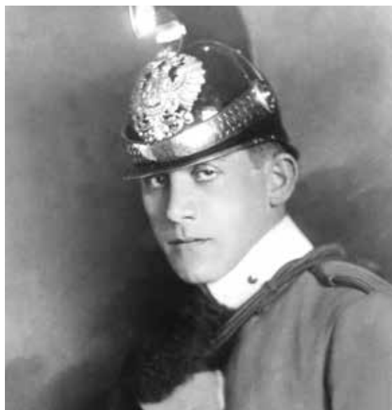
Oskar Kokoschka als Kriegsfreiwilliger im Dragonerregiment Nr. 15, 1915

Die politischen Geschehnisse und der Bürgerkrieg im austrofaschistischen Österreich sowie der Tod der Mutter veranlassen Oskar Kokoschka im Herbst 1934 Wien in Richtung Prag zu verlassen. In jenen Jahren, in denen der Faschismus über Europa herrscht, setzt sich der Maler, Grafiker und Dichter in Aufsätzen, Essays und Vorträgen verstärkt für die Ideen des Humanismus ein, zudem findet die Politisierung Kokoschkas ihre ersten Höhepunkte. Er ist Mitbegründer der überparteilichen Organisation „Union für Recht und Freiheit“ in Prag, in der sich Künstler und Intellektuelle gegen die Zerstörung