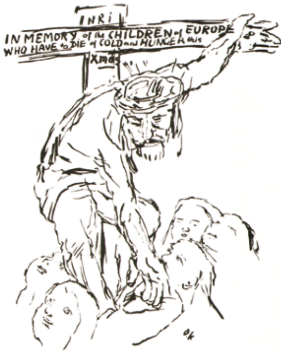
Oskar Kokoschka, Christus hilft den hungernden Kindern, 1945 und 1946

The exhibition on the occasion of the commemorative year 2018 offers a fascinating and often surprising insight into the life and work of Oskar Kokoschka with numerous paintings, drawings, illustrations, posters and photographs with a focus on the political side of the artist. In addition to the collection of the Oskar Kokoschka Documentation as well as works from the Kunstsammlung and the Oskar Kokoschka Center of the University of Applied Arts Vienna, the exhibition also includes pieces on loan from Austrian museums and numerous private collectors.