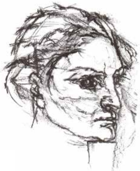
Oskar Kokoschka, Das Gesicht des Weibes, 1913