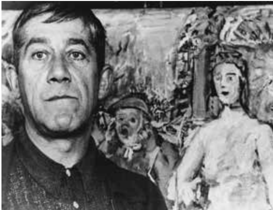
Oskar Kokoschka vor seinem Gemälde „Anschluss – Alice im Wonderland“, London 1942/1943, Foto: Emil Korner

gen werden. Eine eigens in Spanisch verfasste, explizit für die Humanität gegenüber den Wiener Kindern werbende Plakatserie wird in Südamerika verteilt. Der große Einsatz für Humanismus und Frieden sollte Oskar Kokoschka bis ins hohe Alter begleiten: 1973/1974 fertigt der betagte Künstler eine Reihe von Porträts bedeutender Persönlichkeiten Israels an und spendet den Gewinn dieser Grafikmappe der 1966 von Teddy Kollek gegründeten Jerusalem Foundation, die sich das friedliche Zusammenleben der drei Weltreligionen zum Ziel gesetzt hat. Die Ausstellung anlässlich des Gedenkjahrs 2018 bietet mit zahlreichen Gemälden, Zeichnungen, Grafiken, Plakaten und Fotografien einen spannenden und oft überraschenden Einblick in das Leben und Werk Oskar Kokoschkas, wobei die politische Seite des Künstlers im Vordergrund steht. Zusätzlich zu den Eigenbeständen der Oskar Kokoschka Dokumentation sowie Werken der Kunstsammlung und des Oskar Kokoschka-Zentrums der Universität für angewandte Kunst Wien werden in der Ausstellung Leihgaben österreichischer Museen und zahlreicher privater Sammler präsentiert.