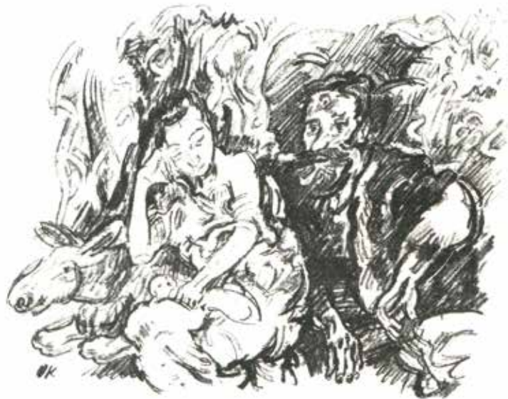
Oskar Kokoschka, Rast auf der Flucht nach Ägypten, 1916

The political events and the civil war in Austro-Fascist Austria as well as the death of his mother prompt Oskar Kokoschka to leave Vienna for Prague in autumn 1934. During those years when fascism ruled Europe, the painter, graphic artist