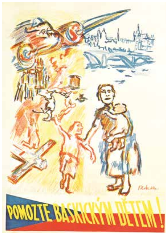
Oskar Kokoschka, Helft den baskischen Kindern!, 1937

Zweig, dem Maler John Heartfield oder dem Theaterkritiker Alfred Kerr im „Free German League of Culture“ (Freier Deutscher Kulturbund) engagiert. Als späterer Präsident der Vereinigung ist er an der Organisation der Kinderkunstaussstellung „The war as seen by children“ beteiligt. In Artikeln und Vorträgen setzt er sich gegen den Nationalsozialismus und verstärkt für die Bildungs- und Jugendarbeit ein, als international bekannter Künstler wird er zur Symbolfigur der Exilgemeinschaften.