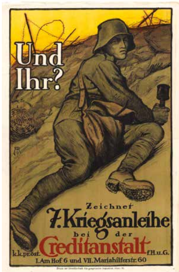
Alfred Roller, Und Ihr? Zeichnet 7. Kriegsanleihe bei der Creditanstalt, 1917